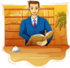
repcionista de hotel