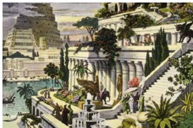
Jardines de Babilonia