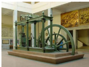
Máquina de vapor