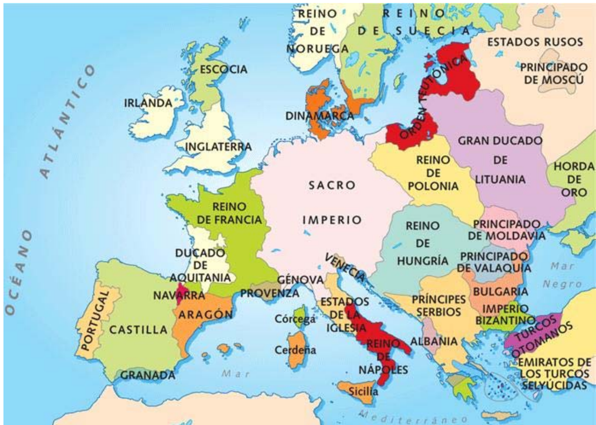
Europa en el año 1.500

Sin embargo, destacaron cuatro grandes reinos sobre el resto: Francia, Inglaterra, España y Rusia.