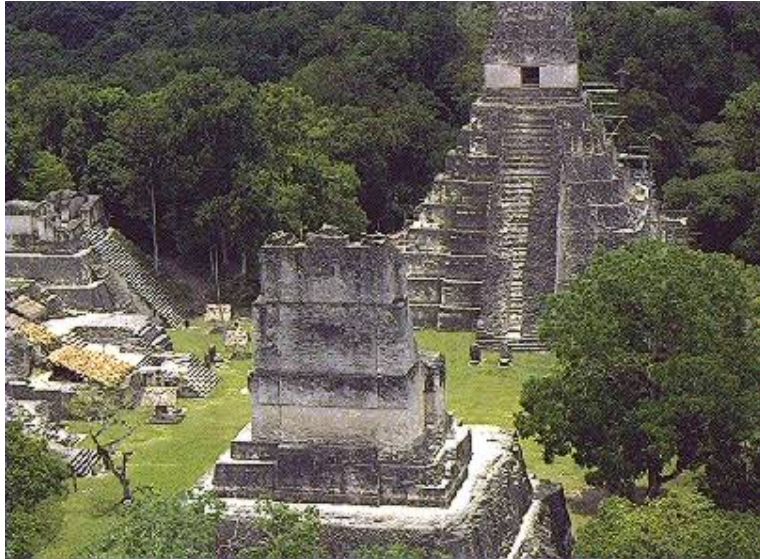
Ejemplo de construcción de los mayas