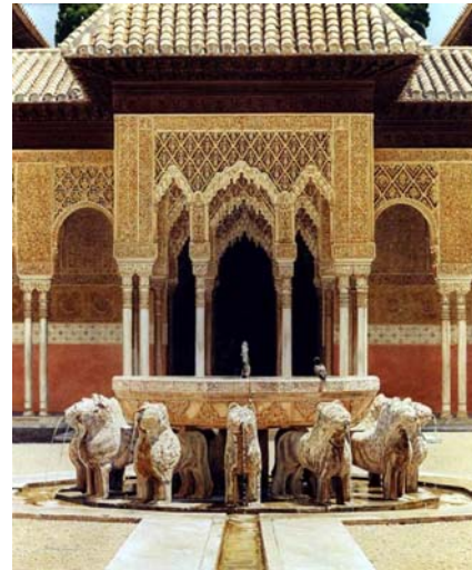
Fuente en el Patio de los Leones de la Alhambra de Granada