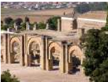
Restos de la ciudad Medina Azahara en Córdoba