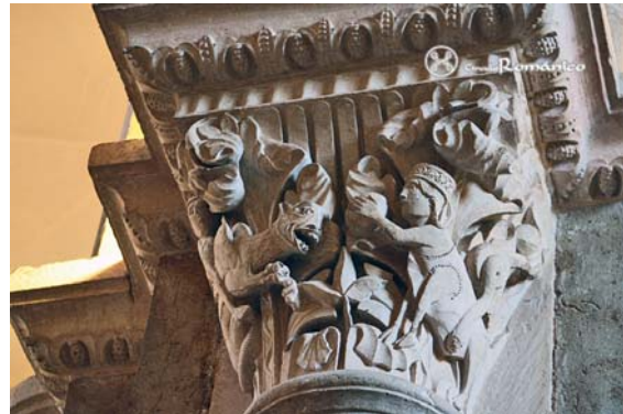
Capitel de la Basílica de Sainte Madeleine en Vézelay (Francia)