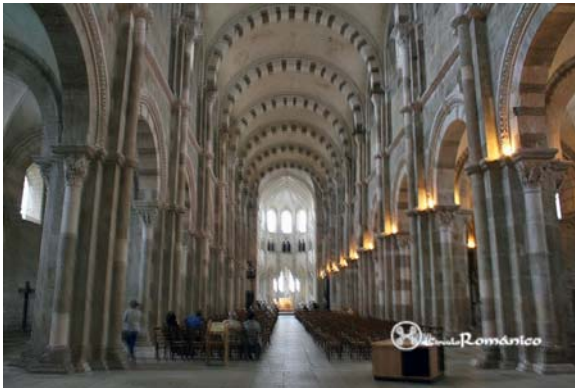
Interior de la Basílica de Sainte Madeleine en Vézelay (Francia) en la que se puede ver la bóveda de cañón.