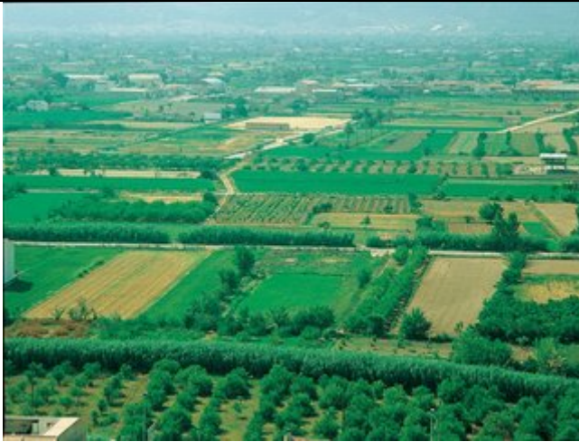
Huerta murciana Paisaje mediterráneo litoral