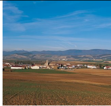
Paisaje mediterráneo interior