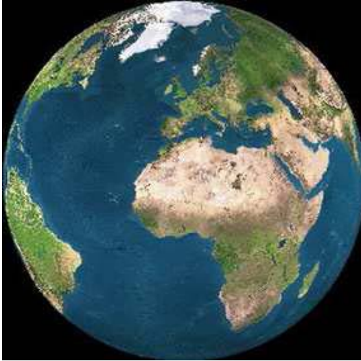
Por una cara