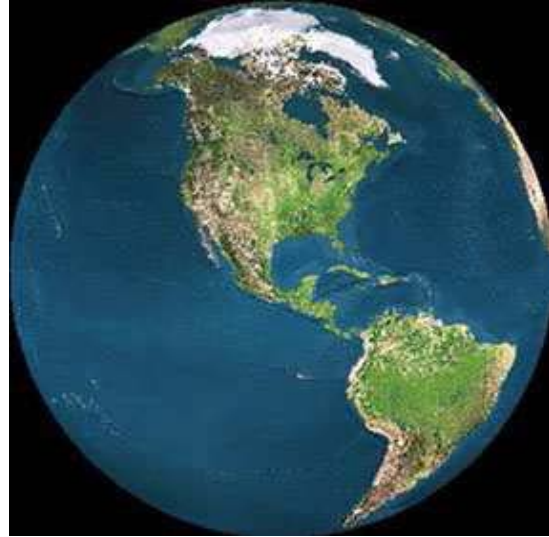
le damos la vuelta

Ahora lo extendemos. Dentro del mundo la zona coloreada es Europa. Intenta señalar España con un círculo.