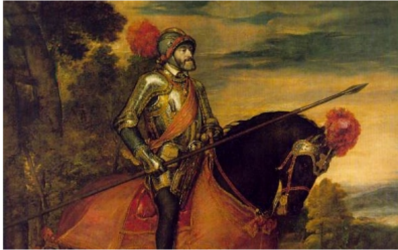
Carlos V en Mühlberg, obra de Tiziano